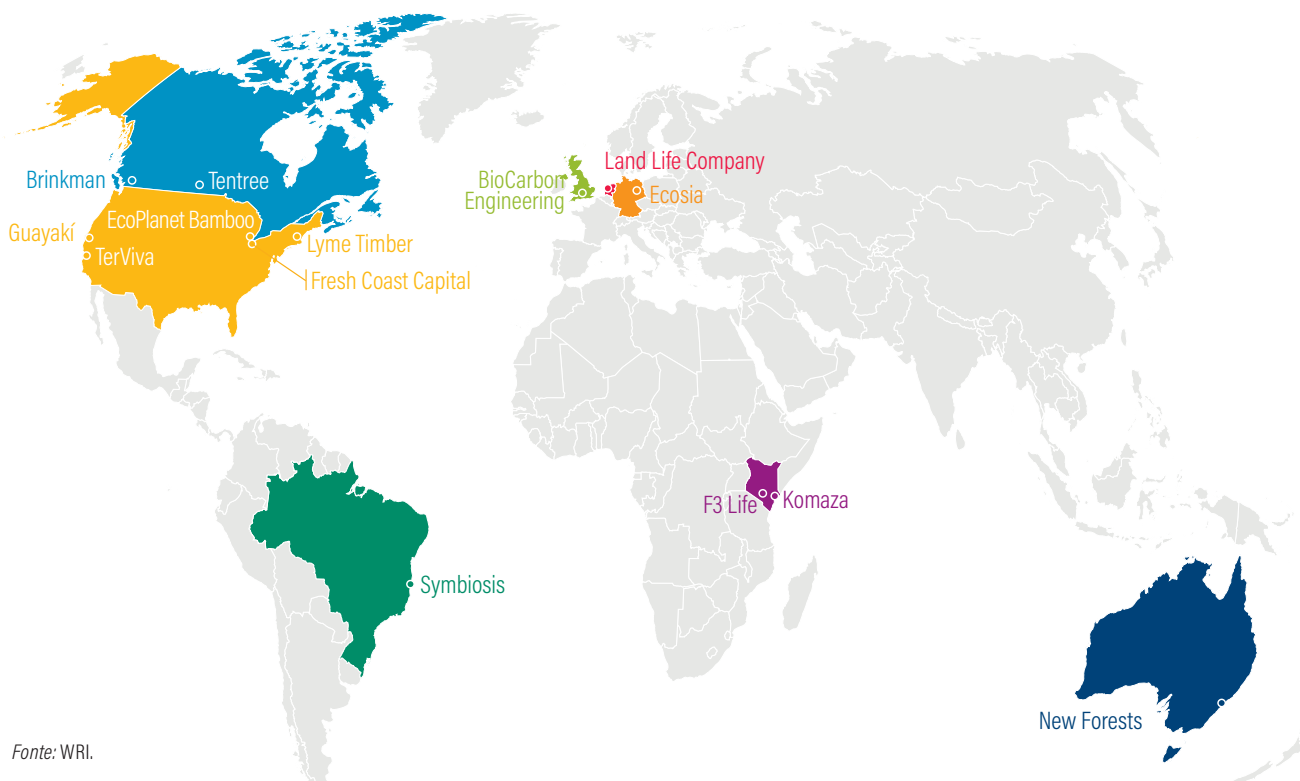
Figura ES-2 | Localização das sedes das empresas apresentadas neste relatório

O conteúdo do relatório não implica em endosso dos negócios apresentados. O WRI e a TNC têm se concentrado na restauração em geral, não em nenhuma empresa deste setor em particular. Fizemos visitas de campo a muitas empresas, mas não conseguimos visitar todas. A maioria das