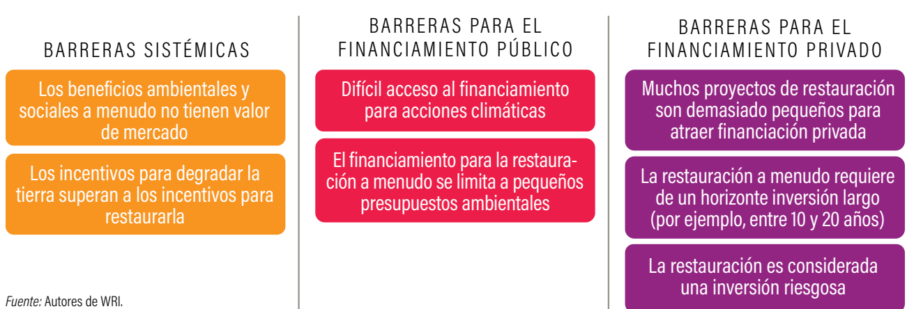
Figura RE-1 | Barreras para el financiamiento de la restauración